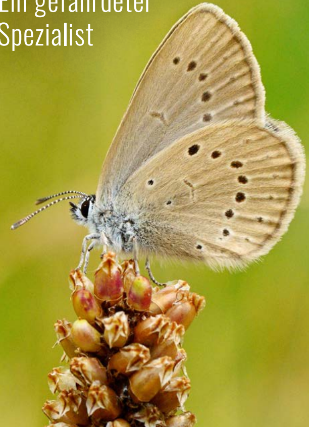
© 2024 | Kreation: Designbüro 2 HEKTAR LAND