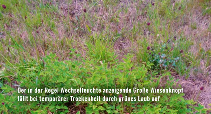
Der in der Regel Wechselfeuchte anzeigende Große Wiesenkopf fällt bei temporärer Trockenheit durch grünes Laub auf