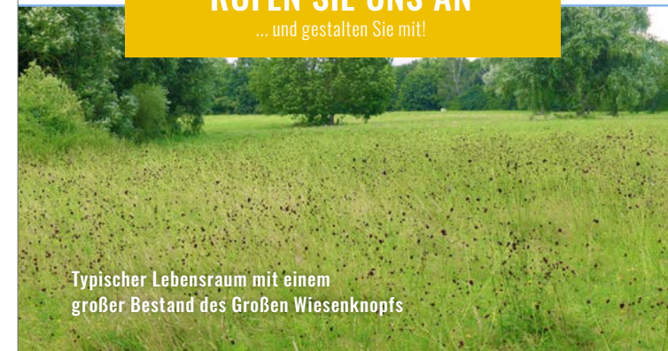
Typischer Lebensraum mit einem großer Bestand des Großen Wiesenknopfs