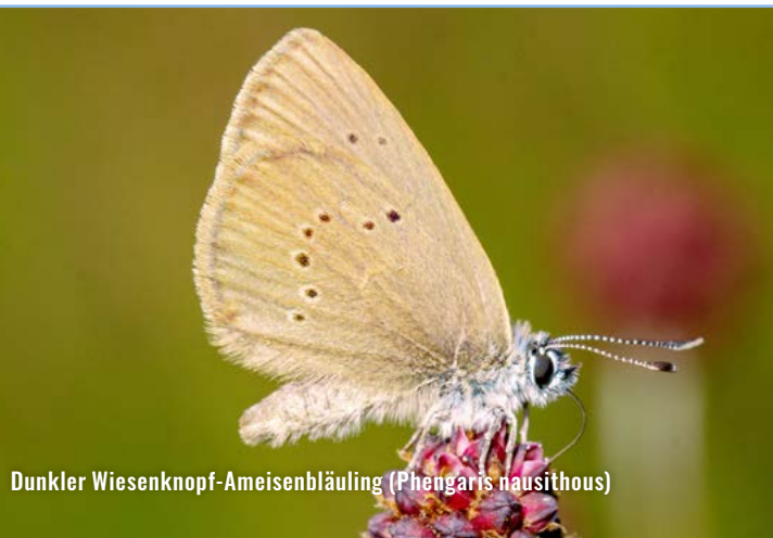
Dunkler Wiesenknopf-Ameisenbläuling ( Phengaris nausithous )