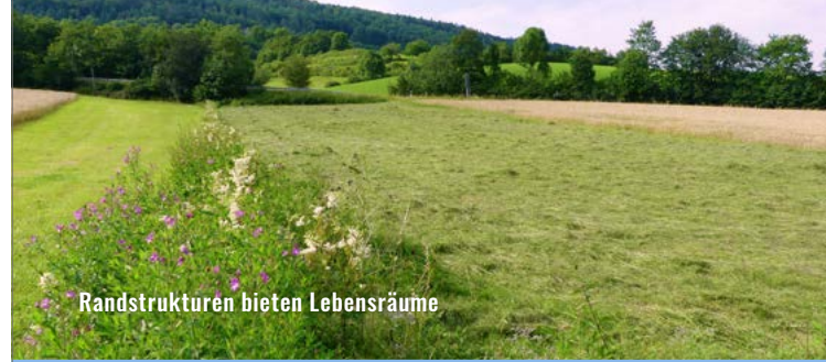
Randstrukturen bieten Lebensräume

Durch einen Rückgang des Lebensraums und deren Vernetzungen ist der Falter stark in seinem Überleben gefährdet . Sein Lebensraum sind artenreiche und gleichzeitig nährstoffarme Wiesen (Wiesenknopf-Glatthaferwiesen, Pfeifengraswiesen und Wiesenknopf-Silgenwiesen). Als vernetzende Elemente können auch Saumstrukturen entlang von Hecken und Wegen sowie Gräben mit Bewuchs der Wirtspflanze dienen. Neben der verbindenden Funktion spielen diese Randstrukturen eine wichtige Rolle bei der Wiederbesiedelung von Flächen, die für den Falter ungünstig genutzt wurden und auf denen die vorhandene Population ausgestorben ist.