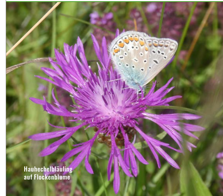
Hauhechelbläuling auf Flockenblume

Bankverbindung: Kasseler Sparkasse DE 85 5205 0353 0011 8480 28