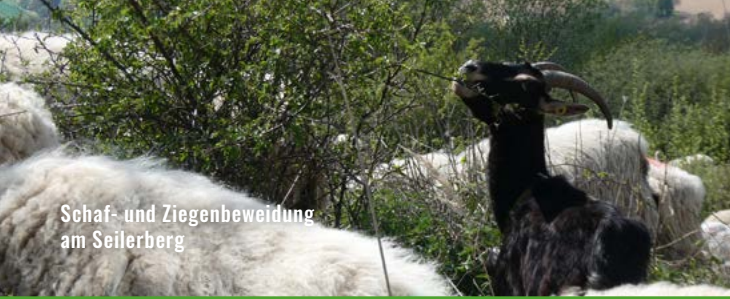
Schaf- und Ziegenbeweidung am Seilerberg