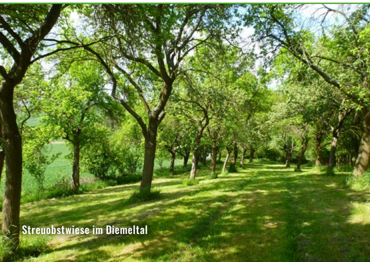
Streuoobstwiese im Diemeltal